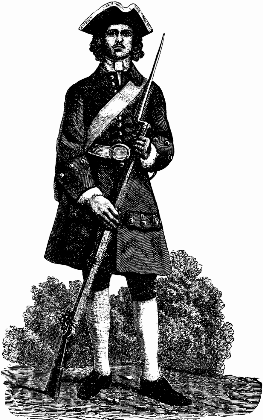
Одежда и вооруженіе потѣшныхъ.